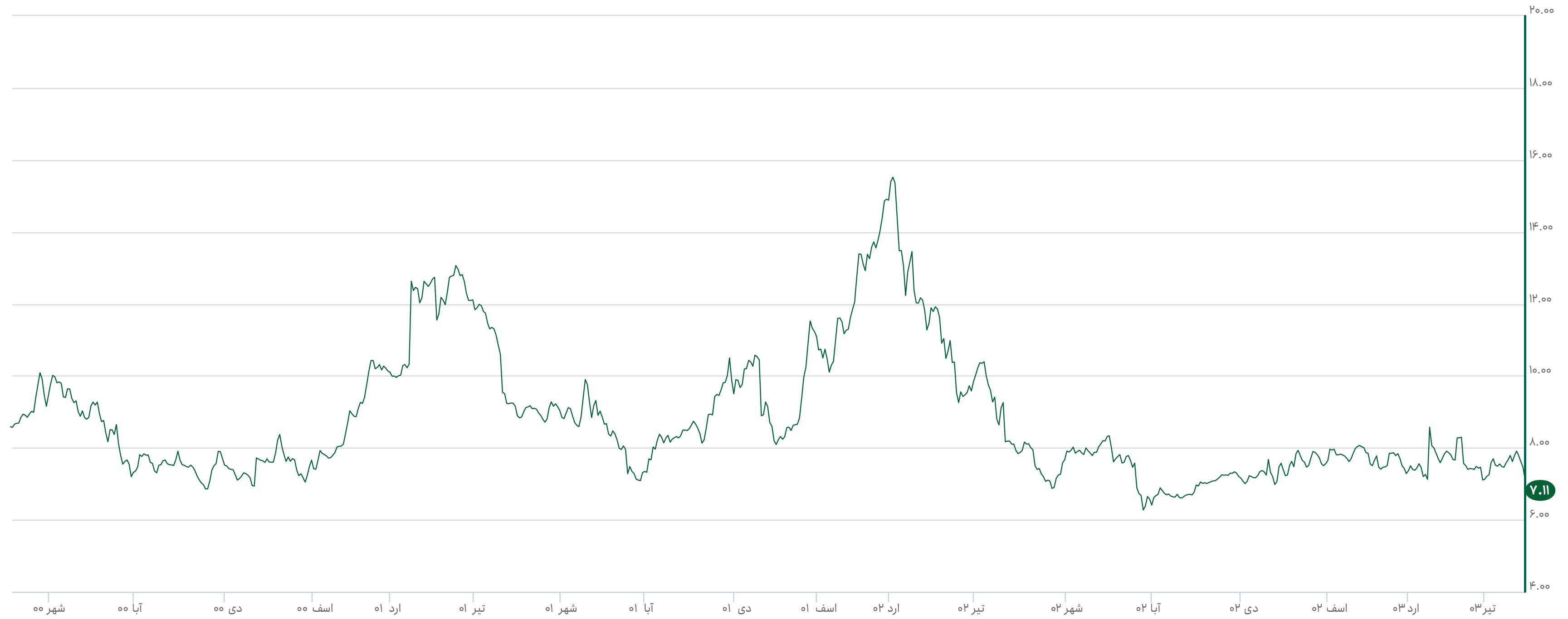
نسبت قیمت به سود محقق شده daily (زغال سنگ) —