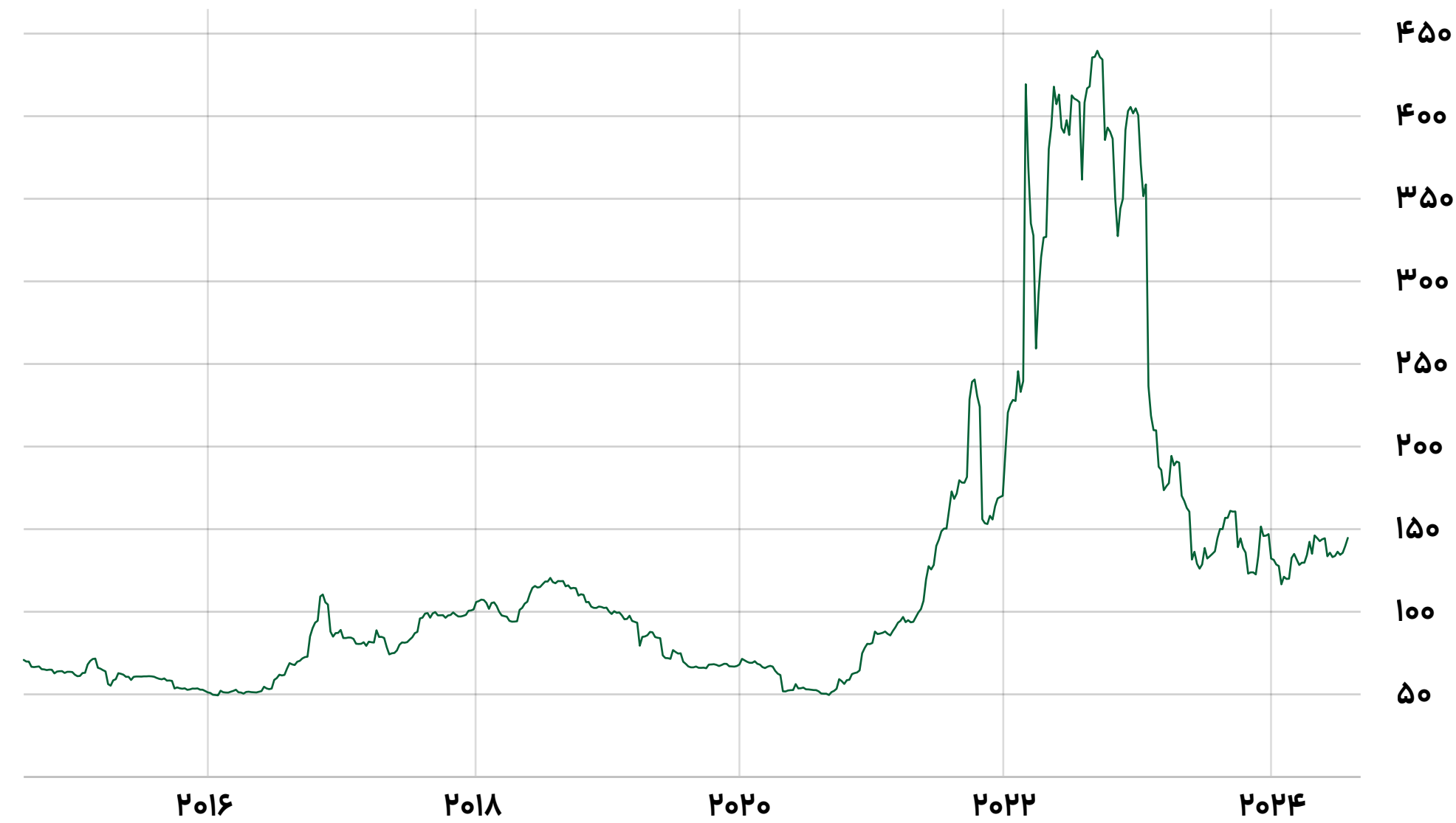
رشد قیمت ذغال سنگ از سال ۲۰۱۵ تا کنون

لازم به ذکر است قیمت جهانی هر تن ذغال سنگ از حدود ۴۴۰ دلار در سال ۲۰۲۲ به ۱۵۰ دلار در سال ۲۰۲۴ افت کرده است. کشورهای چین و هند در رتبه بزرگ‌ترین مصرف‌کنندگان ذغال سنگ در جهان قرار دارند و روند تقاضا از سوی دو کشور، خصوصاً چین رو به کاهش است. پیش‌بینی می‌شود در صورت بهبود وضعیت اقتصادی چین، قیمت جهانی ذغال سنگ نیز افزایش پیدا کند.